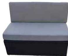
Gerade Sitzbank KF-10029