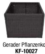
Gerader Pflanzenkorb KF-10027