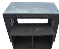
Gerade Bar & Stuhl KF-10035