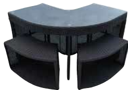
Eckbar mit Stühlen KF-10024