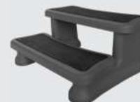
UNIVERSAL SCHWARZE POOLTREPPE L90 x H40 x T60cm KF-10058