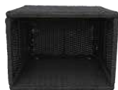
Gerader Beistelltisch KF-10028