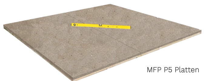
MFP P5 Platten

Fußbodenelemente von unten behandeln, umdrehen und mit einer Wasserwaage ausrichten.