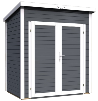
Behandlung: ANTHRAZIT (RAL 7016)