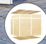
Einfache Elementbauweise Inkl. Fußboden