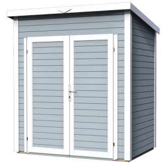
Behandlung: HELLGRAU (RAL 7001)