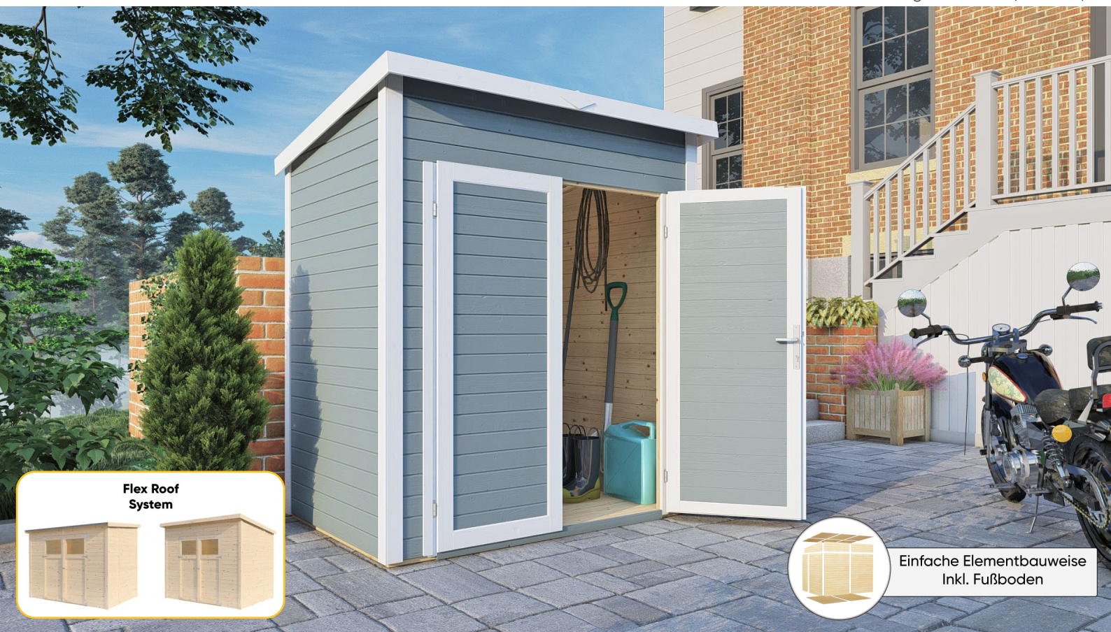
Flex Roof System