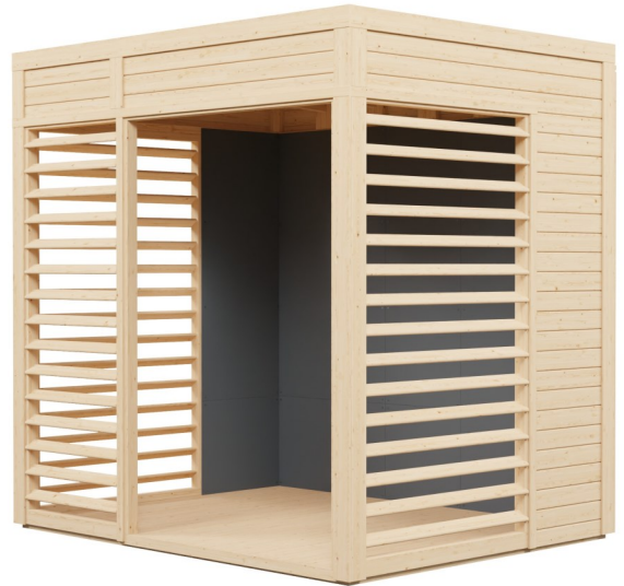
Behandlung: unbehandelt Farbe der Wandverkleidung: anthrazit