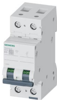
Leitungsschutzschalter 230V 6kA, 1+N-polig, B, 10A